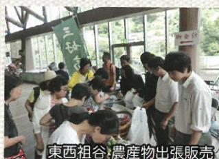
東西祖谷農産物出張販売