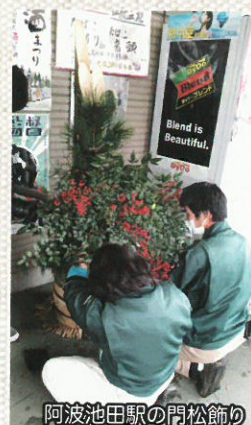
阿波池田駅の門松飾り