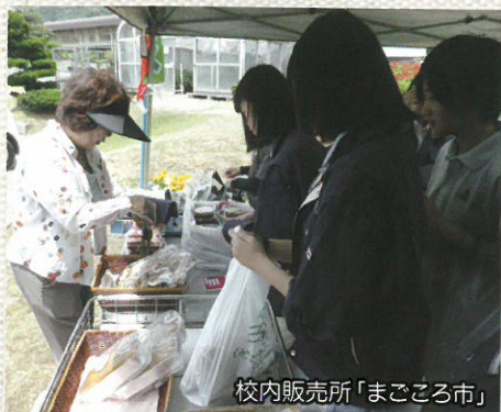
校内販売所「まごころ市」