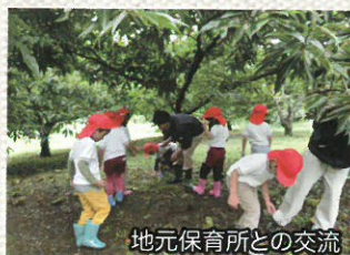
地元保育所との交流